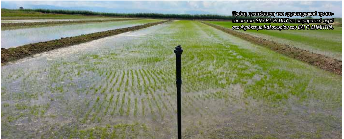
Πρώτη εγκατάσταση του εργαστηριακού πρωτοτύπου του SMART-PADDY σε πειραματικό αγρό στο Αγρόκτημα Καλοχωρίου του ΕΛΓΟ ΔΗΜΗΤΡΑ.